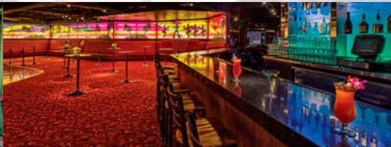
バーとミュージックラウンジ