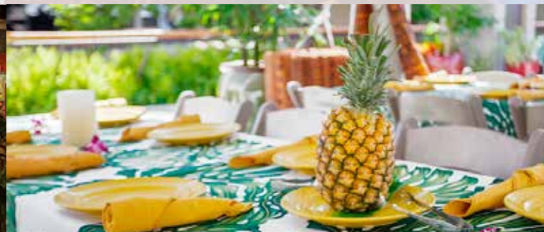
さわやかな屋外カバナ