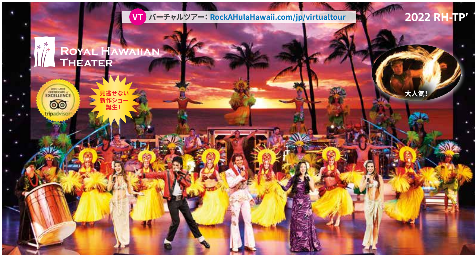
ワイキキ最大のハワイアンショー®“ロック・ア・フラ®”