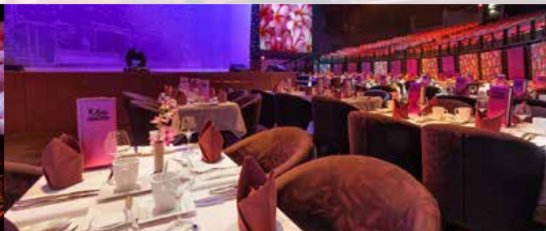
ステージサイドVIP®エリア