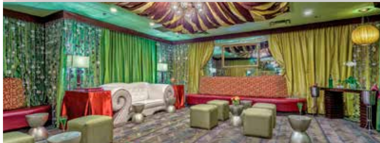
楽屋エリアにある特別室“グリーンルーム®”はプライベートパーティーに