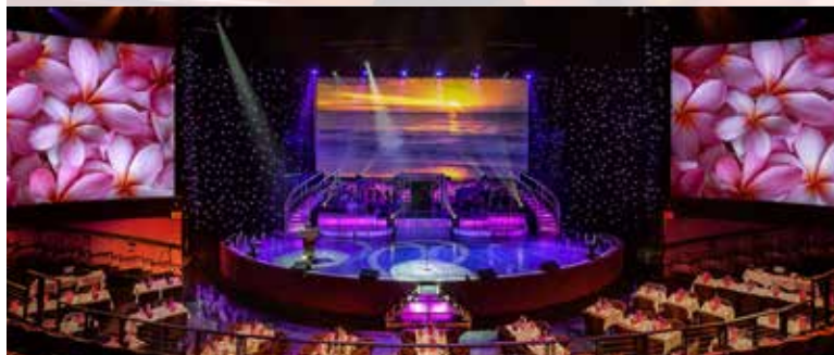
750席のプレミアシアター