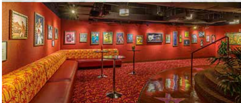
ミュージックラウンジ