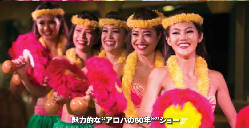
魅力的な“アロハの60年”ショー