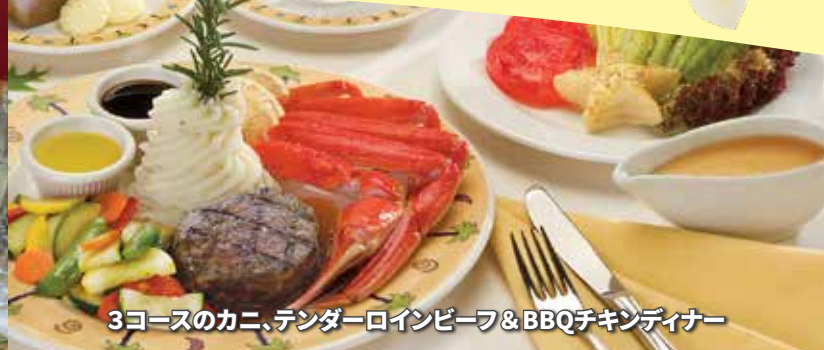
3コースのカニ、テンダーロインビーフ&BBQチキンディナー