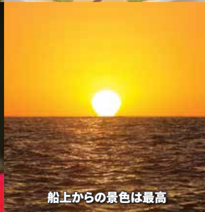
船上からの景色は最高