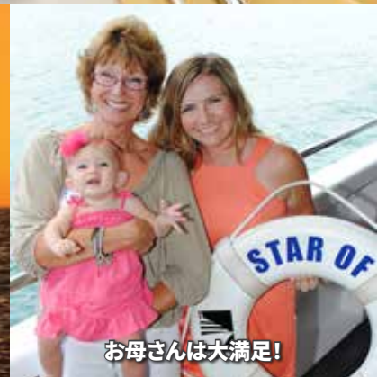
お母さんは大満足!