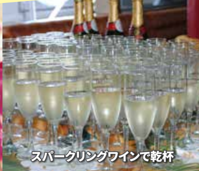
スパークリングワインで乾杯