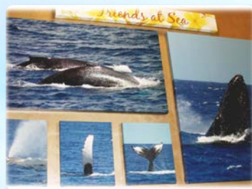
고래 갤러리와 다양한 고래 액티비티