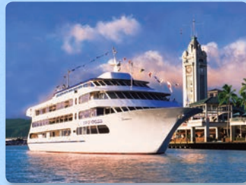
알로하 타워에서 승선 1500명 수용가능한 “더 스타”