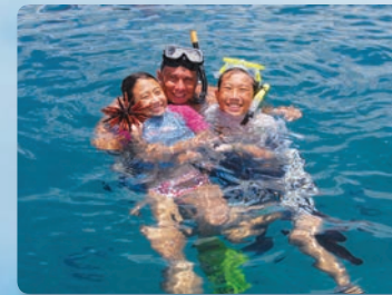
시크릿 스노클링 지점 하와이 경이로운 암초지대