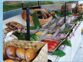
바비큐 뷔페 점심 추가구매 고급 재료를 사용한