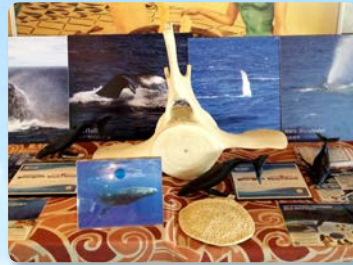
체험 교육 디스플레이와 다양한 고래 액티비티