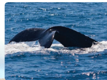
사진 팁 빠른 셔터속도와 줌없이 세팅하세요