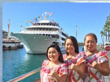
더 스타 승선 3가지 타입의 안전장치 장착