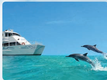
돌핀 스타 승선® 아름다운 와이아나에해안을 따라 항해

오전 9시30분 - 11시30분/ 4월1일 - 12월31일 돌고래 파라다이스로의 여정 바비큐 뷔페 점심 추가구매