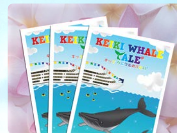
케이키(어린이) 프로그램 기념책자 증정