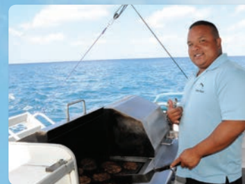
바비큐 뷔페 점심 추가구매 배에서 신선하게 구운 바비큐 뷔페 점심