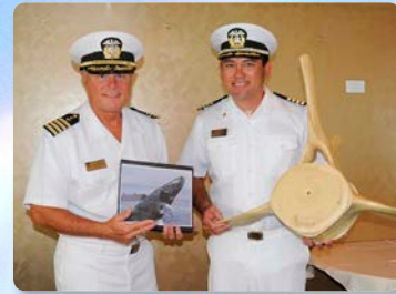
두분의 선장께서 당신의 고래관람을 향상시켜줍니다