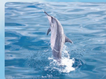
바다의 곡예 돌고래들이 노는 모습을 지켜보세요