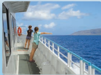
돌핀스타® 두개의 파노라마식 갑판

오전 9시30분 - 11시30분/ 1월2일 - 3월31일 고래와 돌고래를 보세요 바비큐 뷔페 점심 추가구매