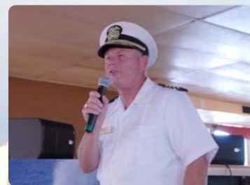
선장의 브리핑을 듣고 고래를 찾아보세요!