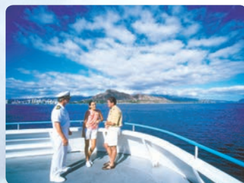
18미터 관람 갑판 고래관람지점