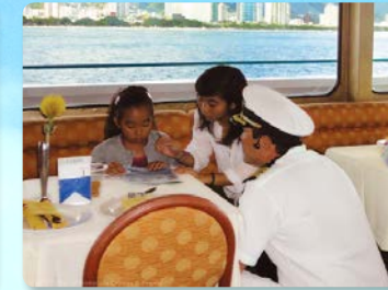
케이키 (어린이) 프로그램 기념책자 증정