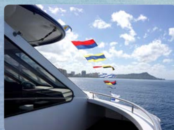
숨막히게 아름다운 해안선 전망을 18미터 높이의 관람 갑판에서 즐겨보세요