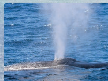
멋진 흑등고래의 숨내뿜기