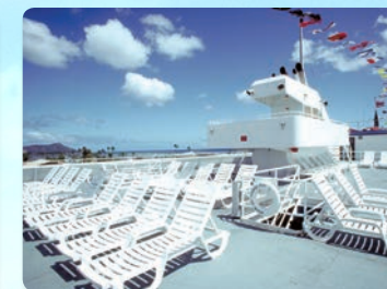
18미터 높이의 관람 갑판 고래관람지점