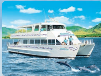
돌핀스타® 편안한 크루즈

오후 12시 - 3시 일년내내 운영 지상낙원에서 완벽한 오후 바비큐 뷔페 점심 포함