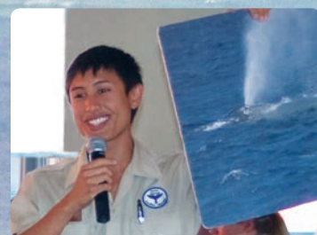
동물학자의 설명을 통해 고래에 관해 배우기