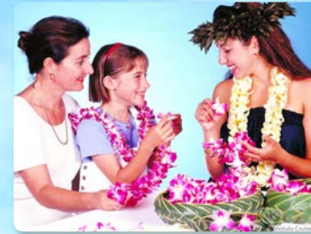
하와이 문화체험 레이 만들기, 훌라와 우쿠렐레 수업