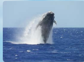
흑등고래 겨울에만 볼수 있는