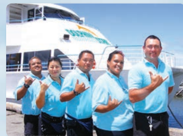
친절한 선장과 크루들과 함께 잊을수 없는 경험