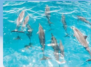
파라다이스로의 여정 매일 평균 50-70마리의 돌고래 목격