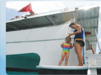
최고의 시설 샤워시설, 화장실 등등 완비