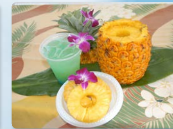
스노클링 후 음료서비스 "블루 돌핀" 칵테일