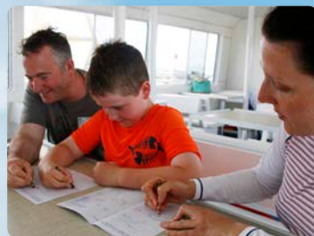
가장 많은 돌고래 액티비티 제공 만질수 있는 전시품 등등