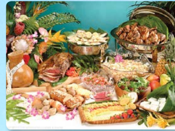
테이스트 오브 하와이 뷔페 로스트비프 카빙서비스와 코나 블렌드 커피 등등