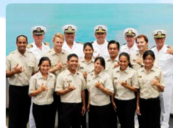
열정넘치는 크루 동물연구 자격증 보유