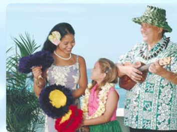
하와이 문화 활동 레이 만들기, 훌라와 우쿠렐레 수업