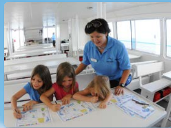
케이티(어린이) 프로그램 교육적이고 상호적