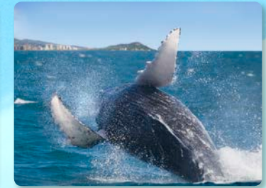
장엄한 흑등고래 고래관람 보장