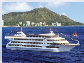
더 스타 승선 다이아몬드 헤드를 지나쳐 항해하는 투어