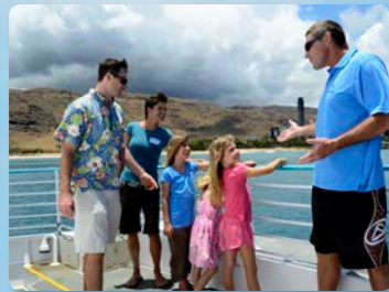
동물학자 자격증 보유 전문가의 설명