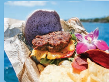
직접 재료를 골라 만드는 오노 고메트 (Ono Gourmet) 햄버거