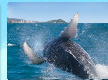
迫力のザトウクジラ クジラが見える保証付き