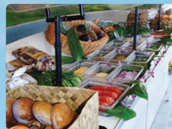
BBQピュッフェランチ オプション グルメのトッピング