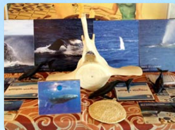
触れる教育的なディスプレイ 一番多いクジラのアクティビティ