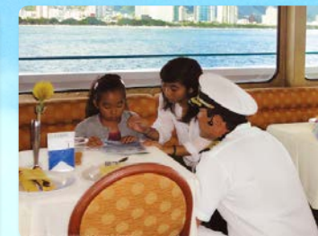
キッズプログラム 学べるお土産付き