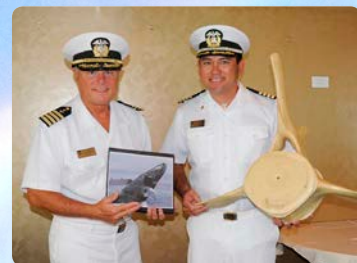
2名のキャプテン乗船 皆様のクジラ体験をより確実に