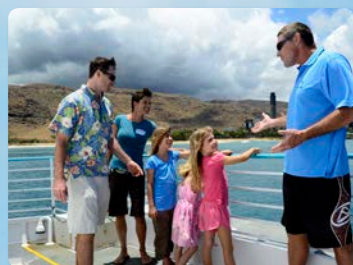
資格を持ったナチュラリスト ナレーション、アクティビティ