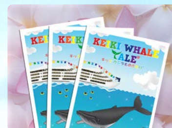
キッズプログラム 学べるお土産付き