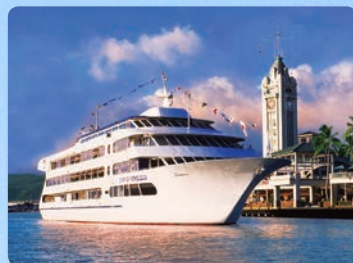
アロハタワー乗船 スター号、1500人乗り