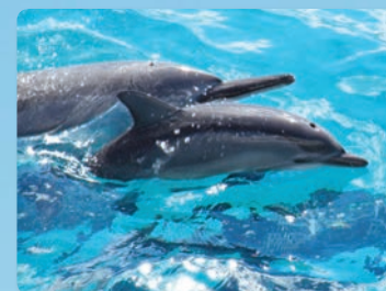
自然の生息環境で ハワイアン ハシナガイルカ