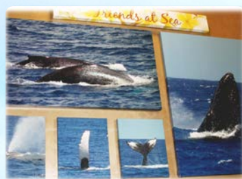
ホールギャラリー 一番多いクジラのアクティビティ