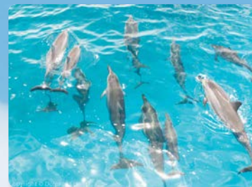
ドルフィンパラダイスへの旅 ほぼ毎日50~70頭の イルカに会える