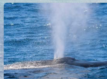
迫力のザトウクジラ “ブロー”