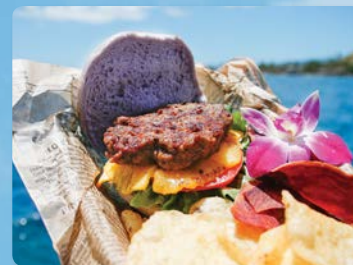
自分で組み立てる 美味しいグルメバーガー