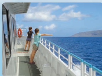
ドルフィンスター®号 2層のパノラマデッキ

9:30~11:30AM / 1/2~3/31 クジラとイルカに会おう BBQピュッフェランチ オプション