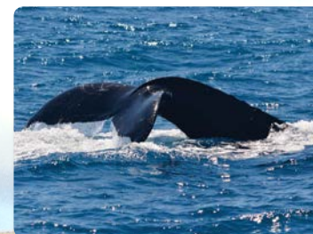
写真撮影のヒント 速いシャッタースピードと ノンズームのセッティングで

大人1人にお子様（3～11歳） 1人無料（食事と送迎は オプションとなります）。