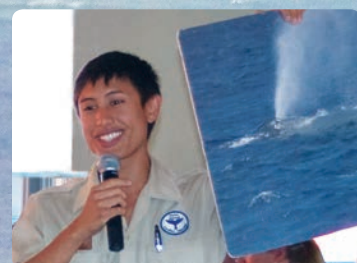
ナチュラリストのデモンストレーション 楽しい教育プログラム