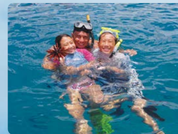
知られざるスノーケリングスポット カラフルなハワイのサンゴ礁