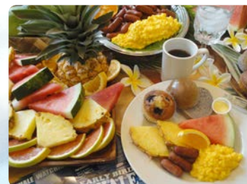
あたたかい朝食ビュッフェ コナブレンドコーヒー、紅茶、 オレンジジュース付き