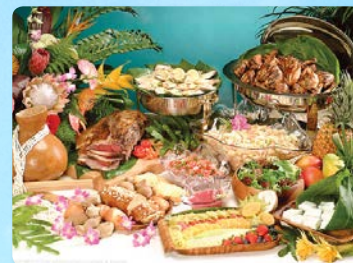
テイストオブハワイビュッフェ その場で切り分けるローストビーフ コナブレンドコーヒーなど盛り沢山