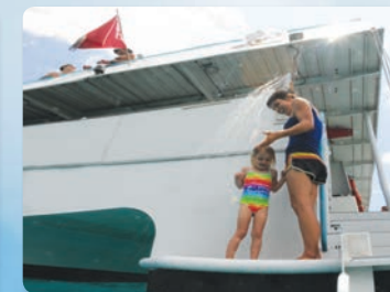
ベストの設備 真水のシャワー、船上トイレなど