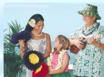
ハワイアンカルチャー体験 レイメイキング、フラとウクレレレッスン