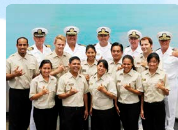
海が大好きなクルー 資格を持ったナチュラリスト