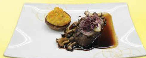
ローストした最高級プライム テnderロインビーフ 黒トリュフとガーリックの香り ワイルドマッシュルームのラグー、ダッチェスレッド プリスポテ、ポートワインのデミグラスソース