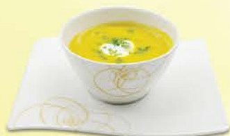
ローストしたカボチャの ビスクスープ クリームフレッシュとチャイブ