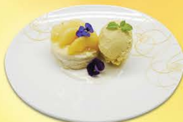
アップルチーズケーキのガレット& パンプキンジェラート クリームアングレーズ