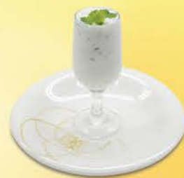
お口直しのシャーベット ライムとバジルのシャーベット