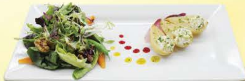
ゴルゴンゾーラを詰めたポーチした 洋ナシとミックスグリーンサラダ インゲン豆、ベビーキャロット、クルミ、 桃とアップルサイダービネグレット