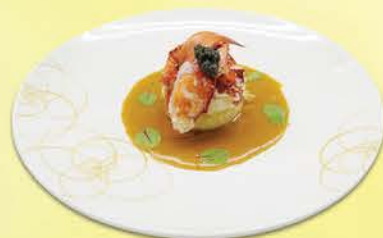
空輸されたバターでポーチした 活メインロブスター パドルフィッシュのキャビア、 スパゲティースクワッシュとダイコン、 ブランデーアメリカヌソース